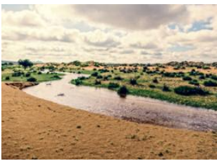
Vallée de l'Orkhon 🚗 240km - ⌚ 4h 30m Khögnö Khan