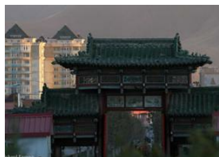
Oulan Bator 📍