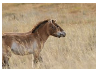
Oulan Bator 📍