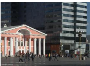
Khögnö Khan 🚗 280km - ⌚ 4h 30m Oulan Bator