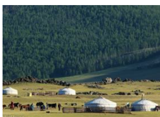
Unt Am 📍 🚗 80km - ⌚ 3h Vallée de l'Orkhon 📍