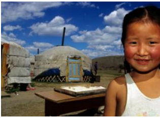
Vallée de l'Orkhon