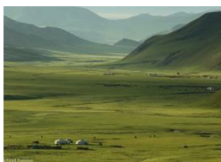
Karakorum 📍 🚗 30km - ⌚ 1h 15m Unt Am 📍