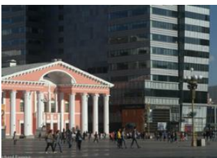
Khögnö Khan 📍 🚗 280km - ⌚ 4h 30m Oulan Bator 📍