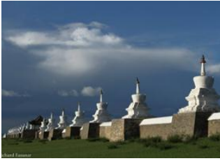
Parc national de Khustai 📍 🚗 270km - ⌚ 4h 30m Karakorum 📍