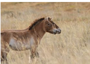
Oulan Bator 📍 🚗 130km - ⌚ 2h 30m Parc national de Khustai 📍