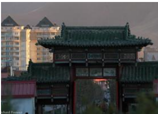
Oulan Bator 📍