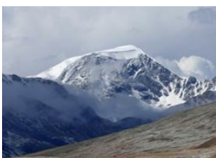
Oulan Bator 📍