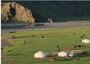
Chaînes du khangai 📍 50km - ⌚ 5h 30m Vallée de l'Orkhon 📍