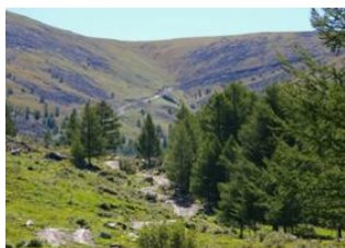
Naiman nuur 📍 18km - ⌚ 5h 15m Naiman nuur 📍