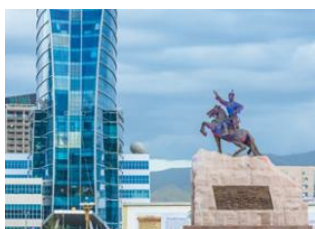
Oulan Bator 📍