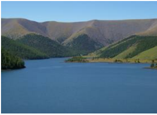
Vallée de l'Orkhon 📍 🚗 130km - ⌚ 5h Naiman nuur 📍