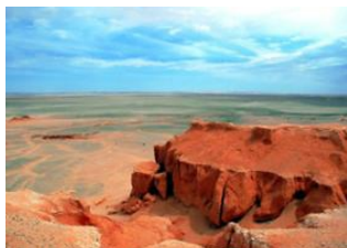
Monastère d'Ongii 📍 🚗 150km - ⌚ 4h 30m Bayanzag 📍