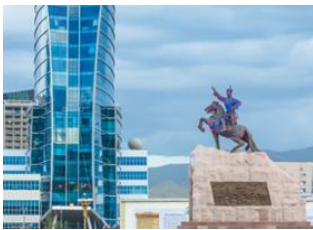
Oulan Bator 📍