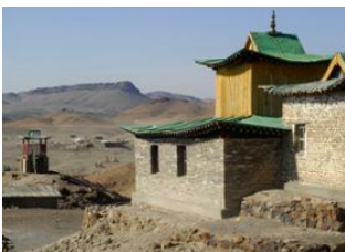
Naiman nuur 📍 🚗 120km - ⌚ 4h Arvaikheer 📍 🚗 180km - ⌚ 3h 30m Monastère d'Ongi 📍