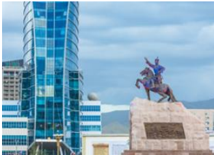
Oulan Bator 📍