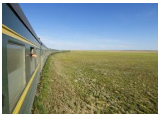
Oulan Bator 📍