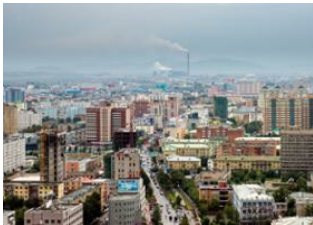
Parc national de Terelj 📍