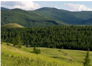
Vallée de l'Orkhon 📍 🚗 180km - ⌚ 5h Naiman nuur 📍