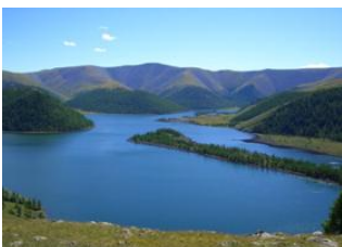
Naiman nuur 📍 15km - ⌚ 4h Lac de Shireet 📍 Naiman nuur 📍