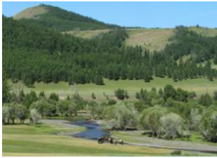
Oulan Bator 📍 🚗 80km - ⌚ 2h Parc national de Terelj 📍