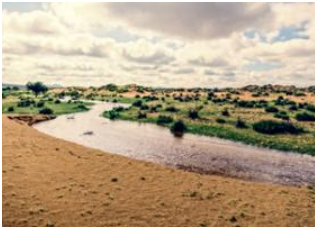
Parc national de Khustai 📍 🚗 210km - ⌚ 3h 30m Khögnö Khan 📍