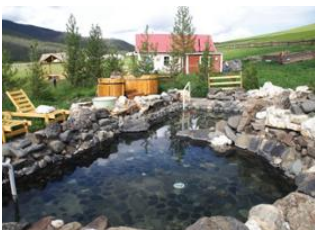
Chaînes du Khangai 📍 21km Sources chaudes de Tsenkher 📍