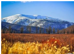
Burkhan Kaldun 📍