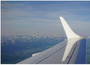
Oulan Bator 📍