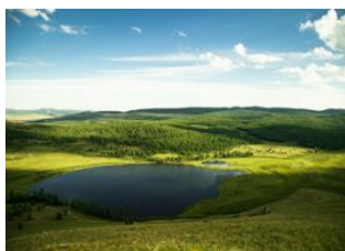
Burkhan Kaldun 📍