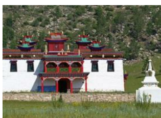
Khar zurkhni khukh lake 📍