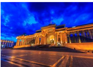
Gün Galuut 📍 🚗 130km - ⌚ 2h 30m Oulan Bator 📍