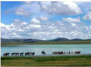
Monastère de Baldan bereeven 📍 🚗 250km - ⌚ 6h Gün Galuut 📍