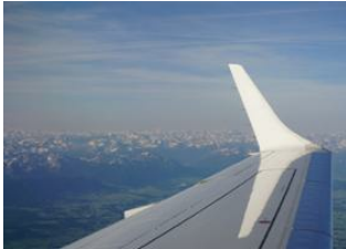
Oulan Bator 📍