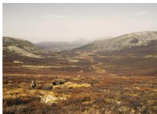
Tsagaan nuur 📍 30km - ⌚ 5h Campement Tsaatan 📍