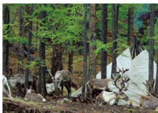
Campement Tsaatan 📍 15km - ⌚ 2h 30m Campement Tsaatan 📍