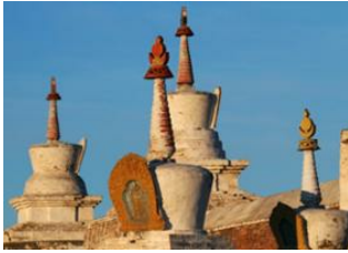
Parc national de Khustai 📍 🚗 270km - ⌚ 4h 30m Karakorum 📍