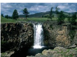
Vallée de l'Orkhon 📍 8km - ⌚ 1h 30m