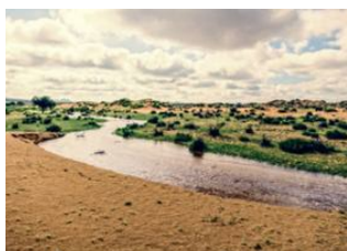
Naiman nuur 📍 🚗 260km - ⌚ 5h 30m Khögnö Khan 📍