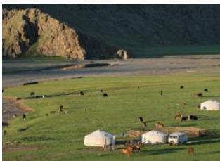
Karakorum 📍 🚗 92km - ⌚ 3h Monastère de Tövkhön 📍 🚗 42km - ⌚ 1h 15m Vallée de l'Orkhon 📍