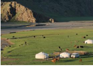
Khujirt 📍 🚗 80km Vallée de l'Orkhon 📍