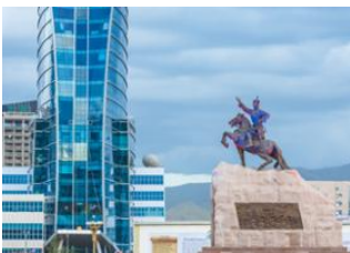
Parc national de Terelj 📍 🚗 80km Oulan Bator 📍