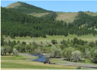
Village de Terelj 📍 30km - 📏 8m Parc national de Terelj 📍