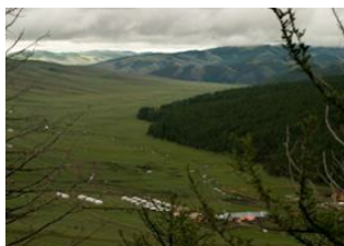
Khögnö Khan 📍

🚗 185km - ⌚ 3h Sources chaudes de Tsagaan Sum 📍