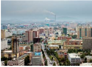
Karakorum 🚗 380km - ⌚ 6h Oulan Bator