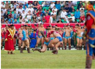
Oulan Bator 📍