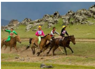
Oulan Bator 📍

🚗 40km - ⌚ 1h Khui Doloon Khudag 📍 🚗 40km - ⌚ 1h Oulan Bator 📍