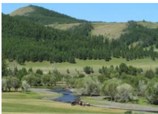
Oulan Bator 📍 🚗 80km - ⌚ 2h Parc national de Terelj 📍