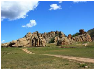
Parc national de Terelj