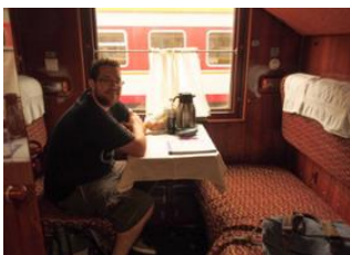
Parc national de Terelj