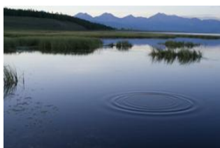
Alag Tsar 📍

Accompagnés d'éleveurs locaux, et de leurs yacks nous partons pour une journée en randonnée à pied ou à cheval , dans les vallées arborées d'Alag Tsar. Suivant le rythme paisible de la charrette, nous découvrons cette terre de nomadisme. Région fleurie, au cœur de l'été vous évoluerez littéralement sur un champ d'edelweiss, tandis qu'à l'ouest vous verrez sur la rive opposée, les sommets culminant plus de 3000 mètres se baigner dans les eaux cristallines du lac.