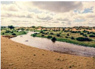
Vallée de l'Orkhon 📍 🚗 130km - ⌚ 3h 30m Karakorum 📍 🚗 110km - ⌚ 1h 30m Khögnö Khan 📍