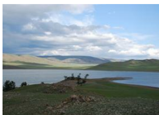
Alag Tsar 📍 🚗 130km - ⌚ 3h Mörön 📍 🚗 130km - ⌚ 3h Shine Ider 📍