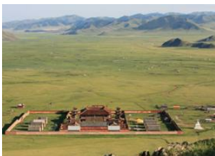
Oulan Bator 📍