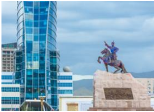
Oulan Bator 📍