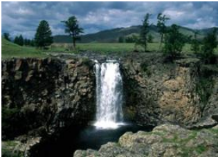
Vallée de l'Orkhon 📍 8km - ⌚ 1h 30m Orkhon cascades 📍 Vallée de l'Orkhon 📍