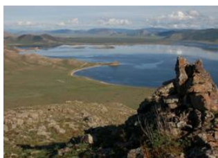
Shine Ider 📍 🚗 180km - ⌚ 6h Parc national de Terkhiin Tsagaan 📍