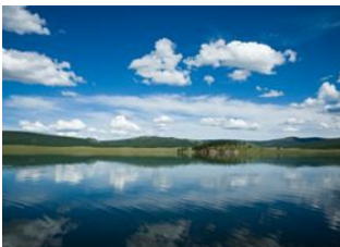
Parc national d'Uran Togoo 📍