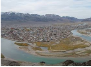
Shiveet Khaïrkhan 📍 🚗 220km - ⌚ 6h 30m Ölgii 📍