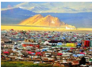
Oulan Bator 📍