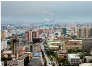
Ölgii 📍 ✈️ 1700km - ⌚ 2h Oulan Bator 📍