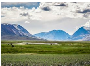
Région de Syrgaal 📍 🚗 180km - ⌚ 5h 30m Zagast nuur 📍