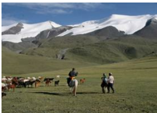
Zagast nuur 📍 21km - ⌚ 6h Shiveet Khaïrkhan 📍