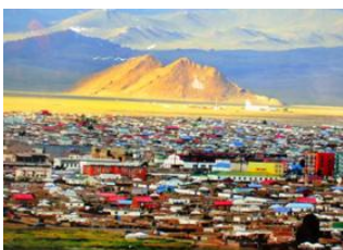
Oulan Bator 📍 ✈️ 1500km - ⌚ 1h 30m Khovd 📍