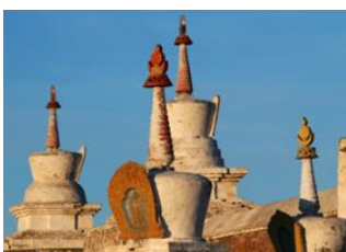
Parc national de Khustai 📍 🚗 270km Karakorum 📍