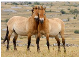
Oulan Bator 📍 🚗 130km - ⌚ 2h 30m Parc national de Khustai 📍