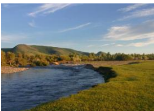
Battsengel 📍 30km - 🕒 5h Rivière tamir 📍