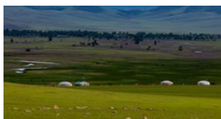
Rivière chuluut 📍 20km - ⌚ 4h Rivière Suman 📍