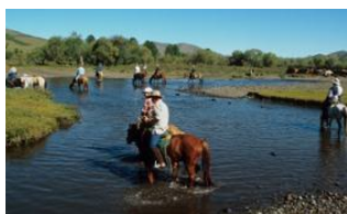
Burgat 📍 33km - ⌚ 5h 30m Rivière Khanuï 📍