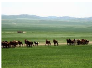
Rivière tamir 📍 38km - ⌚ 6h Vallée d'Agt 📍