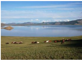
Rivière Suman 📍 20km - ⌚ 4h Tariat 📍