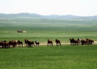
Rivière tamir ♡ 38km - ⌚ 6h Vallée d'Agt ♡