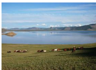
Rivière Suman 📍 20km - ⌚ 4h Tariat 📍