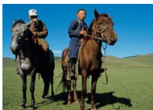
Vallée d'Agt 📍 25km - ⌚ 5h Burgat 📍