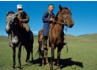
Vallée d'Agt ♡ 25km - ⌚ 5h Burgat ♡