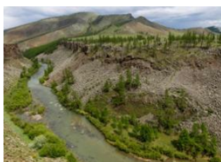
Rivière Khanuï 📍 38km - ⌚ 6h Rivière chuluut 📍