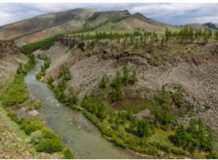
Rivière Khanuí 📍 38km - ⌚ 6h Rivière chuluut 📍