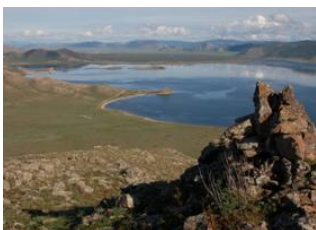
Tariat 📍 30km - ⌚ 5h Parc national de Terkhiin Tsagaan 📍