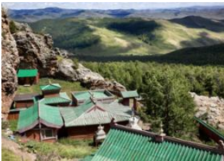
Vallée de l'Orkhon 📍 🚗 42km - 🕒 1h 15m Monastère de Tövkhôn 📍 🚗 180km - 🕒 4h 30m Battsengel 📍