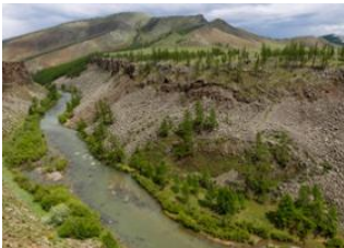
Rivière Khanuï ♡ 38km - ⌚ 6h Rivière chuluut ♡