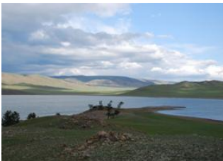
Parc national de Terkhiin Tsagaan 📍 🚗 180km Lac de Züün 📍