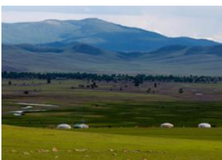
Rivière chuluut ♡