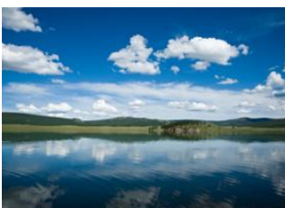
Lac de Züün 📍 🚗 130km