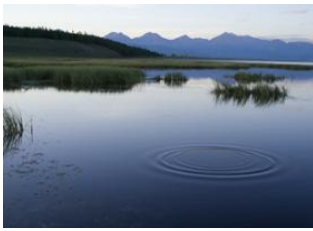
Alag Tsar 📍