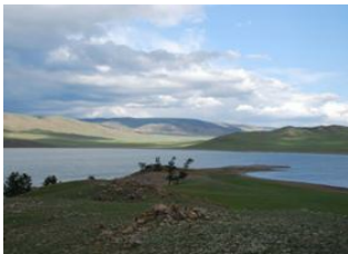
Alag Tsar 📍