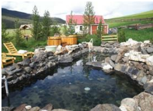
Parc national de Terkhiin Tsagaan 📍