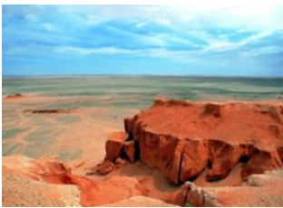
Monastère d'Ongii 📍 🚗 150km - ⌚ 4h 30m Bayanzag 📍