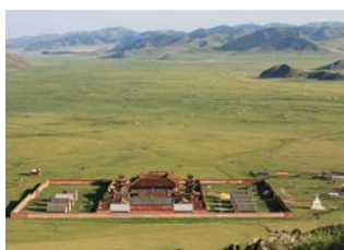
Oulan Bator 📍