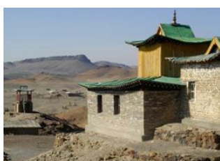
Karakorum 📍 🚗 260km - ⌚ 5h Monastère d'Ongi 📍