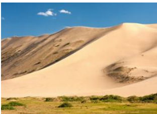
Bayanzag 📍 🚗 40km - ⌚ 1h Pétroglyphes de Khavtsgaït 📍 🚗 160km - ⌚ 4h Dunes de khongor 📍