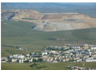
Oulan Bator 📍 🚗 340km - ⌚ 6h Erdenet 📍