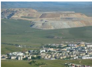
Oulan Bator 📍 🚗 340km - ⌚ 6h Erdenet 📍