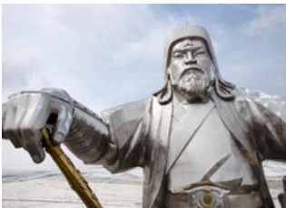
Parc national de Terelj 📍