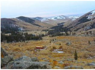
Parc national de Terelj 📍