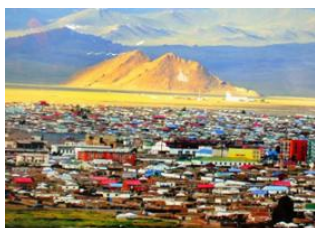
Oulan Bator 📍