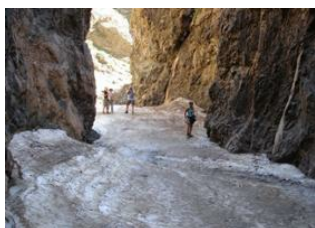
Dunes de khongor 📍