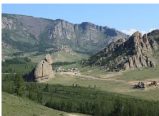
Oulan Bator 📍 🚗 80km - ⌚ 2h Village de Terelj 📍 🚗 10km - ⌚ 30m Camp de base 📍