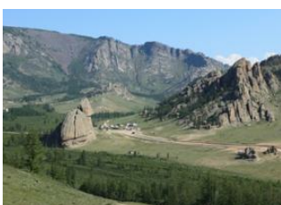
Oulan Bator 📍 🚗 80km - ⌚ 2h Village de Terelj 📍