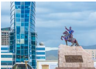
Oulan Bator 📍