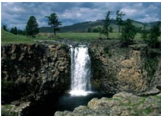
Vallée de l'Orkhon 📍 8km - ⌚ 1h 30m Orkhon cascades 📍 Vallée de l'Orkhon 📍