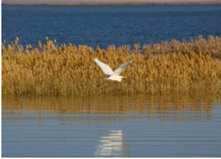
Parc national de Khustai ♡ 🚗 290km - ⌚ 5h Lac d'Ögii ♡