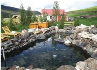
Khögnö Khan 📍 🚗 250km - ⌚ 4h Sources chaudes de Tsenkher 📍