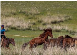
Sources chaudes de Tsenkher 📍 🚗 40km - ⌚ 1h Tsetserleg 📍 🚗 215km - ⌚ 5h 30m Jargalant - chez Bayarsaikhan 📍