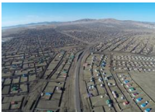
Rivière belt 📍

🚗 120km - ⌚ 4h Mörön 📍 ✈️ 750km - ⌚ 1h 15m Oulan Bator 📍 Mörön 📍