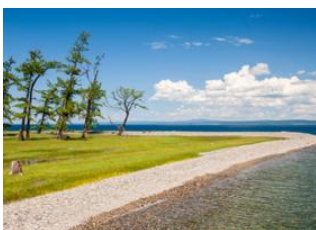
Oulan Bator 📍