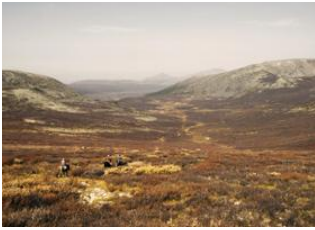
Tsagaan nuur 📍 30km - ⌚ 5h Campement Tsaatan 📍