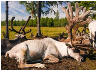
Tsagaan nuur 📍