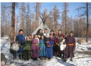
Campement Tsaatan 📍