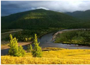
Tsagaan nuur 📍