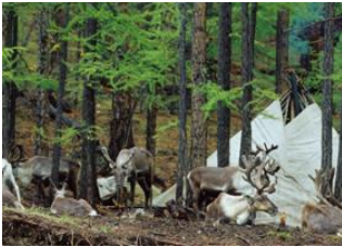
Campement Tsaatan 📍 15km - ⌚ 2h 30m Campement Tsaatan 📍