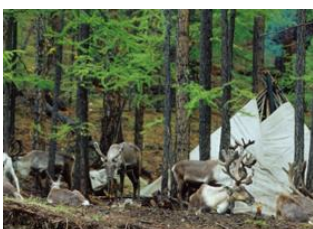
Campement Tsaatan 📍