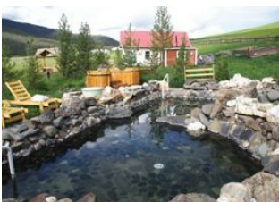
Vallée de l'Orkhon 📍 🚗 42km - ⌚ 1h 15m Monastère de Tövkhön 📍 🚗 110km - ⌚ 4h 15m