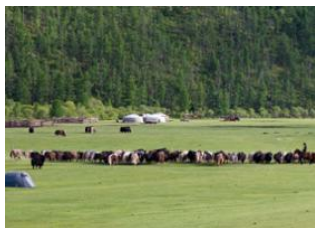
Coude d'Üürt 📍 30km - ⌚ 5h Sources de Mogoït 📍