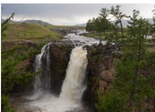
Vallée de l'Orkhon 📍 37km - 🕒 6h Böörgiin Oroi 📍