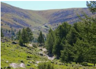
Naiman nuur 📍 30km - ⌚ 5h Boorgiin Oroï 📍