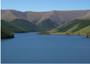
Böörgiin Oroï 📍 30km - ⌚ 5h Naiman nuur 📍