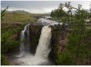
Vallée de l'Orkhon 📍 37km - ⌚ 6h Böörgiin Oroï 📍