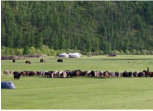
Coude d'Üürt 📍 30km - 🕒 5h Sources de Mogoit 📍