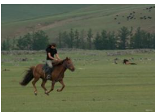
Boorgiin Oroï 📍 20km - ⌚ 4h