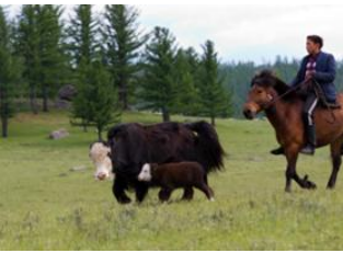
Boorgiin Oroi 📍 20km - ⌚ 4h Vallée de l'Orkhon 📍