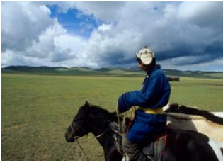
Karakorum 📍 42km - 🕒 6h Khujirt 📍