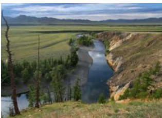
Khujirt 📍 35km - 🕒 5h Coude d'Üürt 📍