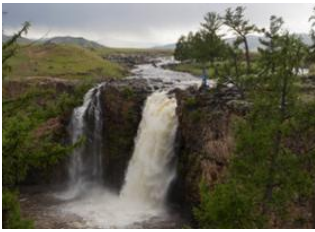
Vallée de l'Orkhon 📍 37km - ⌚ 6h Böörgiin Oroï 📍