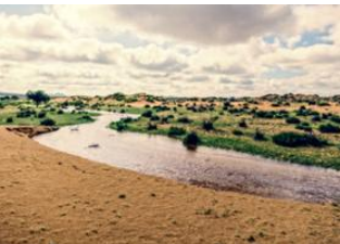
Vallée de l'Orkhon 📍 🚗 240km - ⌚ 4h 30m Khögnö Khan 📍