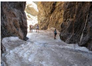
Dunes de khongor 📍 🚗 140km - ⌚ 4h 30m Canyon de dungenee 📍 🚗 20km - ⌚ 1h Canyon de Yol 📍