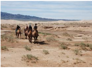
Dunes de khongor 📍