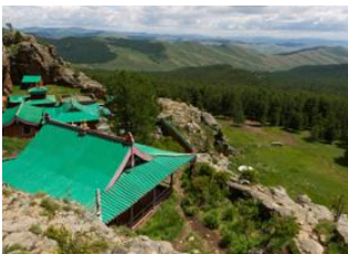
Monastère de Tövkhön 📍 42km - ⌚ 6h Vallée de l'Orkhon 📍 📍