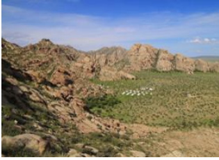
Vallée de l'Orkhon 📍 🚗 240km - ⌚ 4h 30m Khögnö Khan 📍