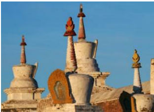
Parc national de Khustai 📍 🚗 270km - ⌚ 4h 30m Karakorum 📍