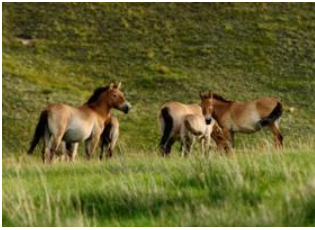
Parc national de Khustai 📍