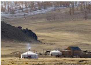
Karakorum 📍 🚗 130km - ⌚ 3h 30m Vallée de l'Orkhon 📍