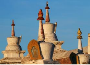
Parc national de Khustai 📍 🚗 270km - ⌚ 4h 30m Karakorum 📍