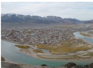
Oulan Bator 📍 ✈️ 1700km - ⌚ 2h Ölgii 📍