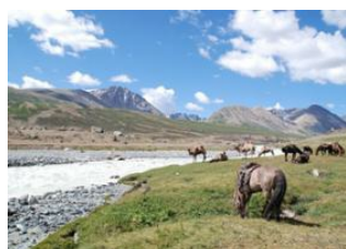
Lac Khoton 📍 45km - ⌚ 9h Vallée de Takhilbai 📍