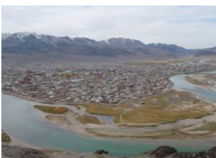
Oulan Bator 📍 ✈️ 1700km - ⌚ 2h Ölgii 📍