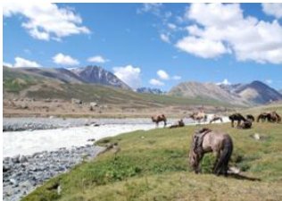
Lac Khoton 📍 45km - ⌚ 9h Vallée de Takhilbai 📍