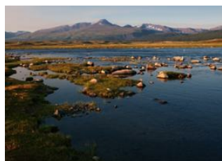
Lac de Khurgan 📍 20km - ⌚ 4h Lac Khoton 📍 20km - ⌚ 4h Lac Khoton 📍