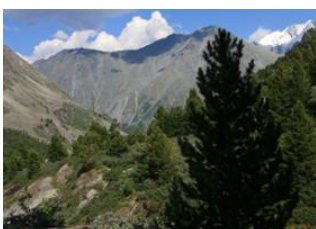
Vallée de Takhilbai 📍 36km - ⌚ 7h Col des monts Altai 📍