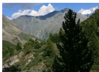
Vallée de Takhilbai 📍 36km - ⌚ 7h Col des monts Altai 📍