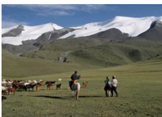
Col des monts Altai 📍 18km - ⌚ 4h Shiveet Khaïrkhan 📍