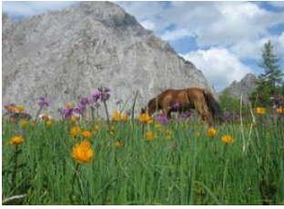
Uvur Khoridol 📍 33km - ⌚ 6h Ölkhön 📍