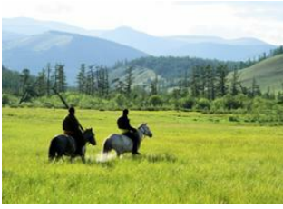
Jankhaï 📍 30km - ⌚ 5h 30m Khelt 📍