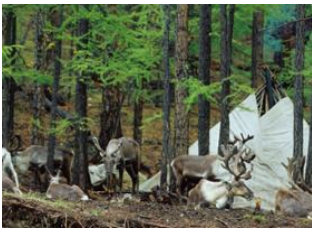
Campement Tsaatan 📍 50km - ⌚ 9h Tsagaan nuur 📍