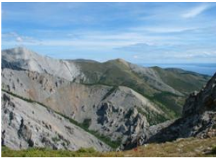
Khelt 📍 30km - ⌚ 5h 30m Col de jigleg 📍