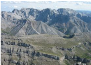
Khoridol 📍 32km - ⌚ 6h Uvur Khoridol 📍