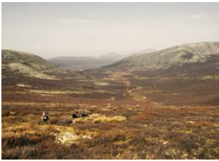
Tsagaan nuur 📍 30km - ⌚ 5h 30m Moorog Uul 📍