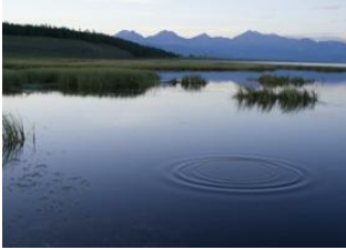
Ölkhön 📍 25km - ⌚ 4h Khatgal 📍 🚗 35km - ⌚ 1h 30m Alag Tsar 📍