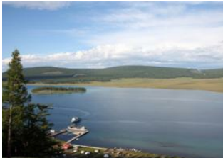
Alag Tsar 📍