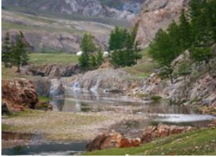
Renchinkhumbe 📍 40km - ⌚ 7h Khoridol 📍