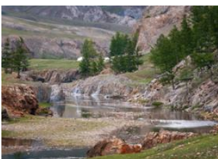
Renchinlkhumbe 📍 40km - ⌚ 7h Khoridol 📍