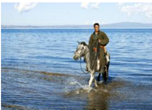
Khatgal 📍 40km - ⌚ 6h 30m Jankhaï 📍