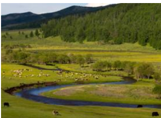
Tsagaan nuur 📍 40km - 🕒 7h Renchinkhumbe 📍