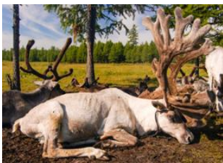
Moorog Uul 📍 20km - ⌚ 3h 30m Campement Tsaatan 📍