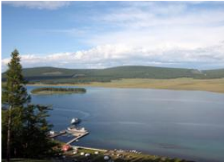
Alag Tsar 📍 35km - ⌚ 5h Khatgal 📍