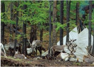
Campement Tsaatan 📍 50km - 🕒 9h Tsagaan nuur 📍