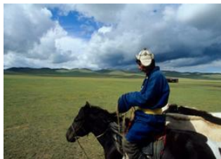
Karakorum 📍 42km - ⌚ 6h 30m Khujirt 📍