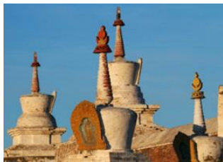
Parc national de Khustai 📍 🚗 270km - ⌚ 4h 30m Karakorum 📍