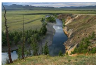
Khujirt 📍 35km - ⌚ 5h Coude d'Üürt 📍