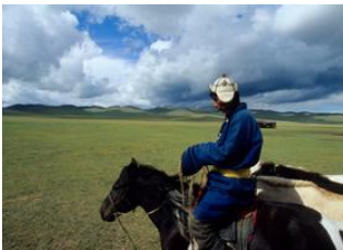
Karakorum 📍 42km - ⌚ 6h 30m Khujirt 📍