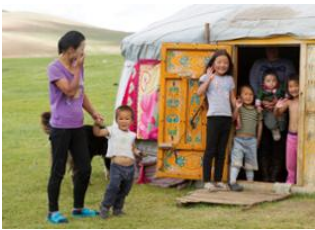
Sources chaudes de Tsenkher 📍 🚗 40km - ⌚ 1h Tsetserleg 📍 🚗 120km - ⌚ 3h Öndör Ulaan 📍