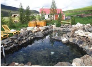
Khögnö Khan 📍 🚗 250km - ⌚ 4h Sources chaudes de Tsenkher 📍